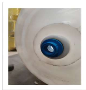
Vista Descarga 32 mm